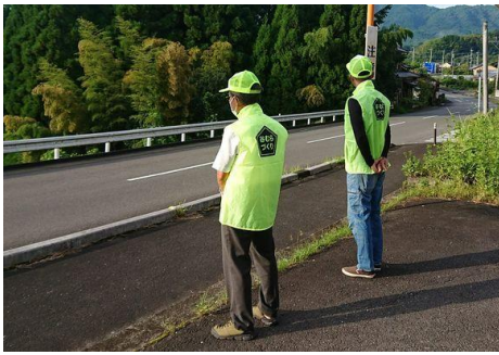
谷小児童の見守り隊活動