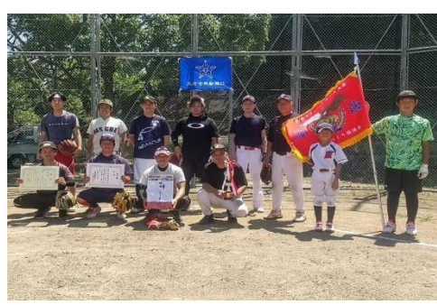
ふるさとソフトボール大会