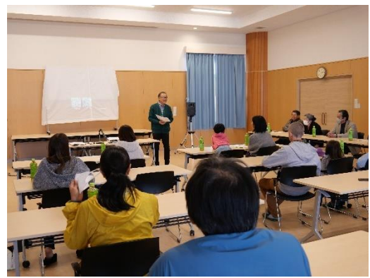
昨年の説明会の様子